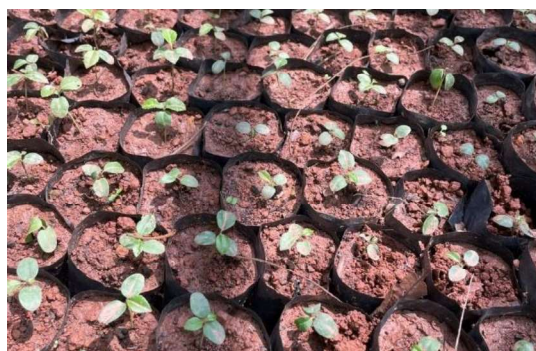
Hình 8. Cây cây mầm vào bầu