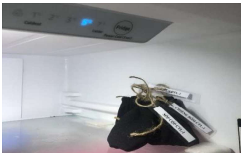
CTL - 1

theo Duncan cũng đã chỉ ra công thức CKL - 2 ( Bảo quản ở nhiệt độ - 5°C ) là tốt nhất với tỷ lệ nảy mầm bình quân đạt 29,0%.