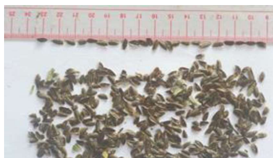
Hình 2. Kích thước hạt Tô hap điện biên