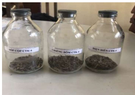
CTK - 4