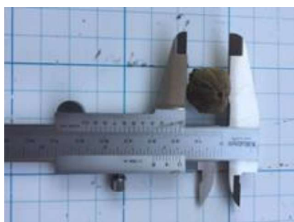
Hình 1. Kích thước quả Tô hap điện biên