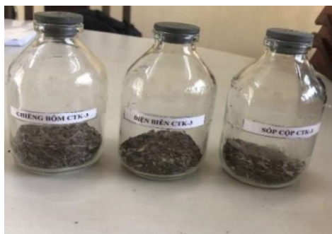
CTK - 3