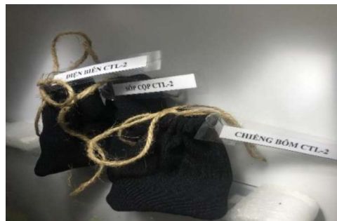
CTL - 2