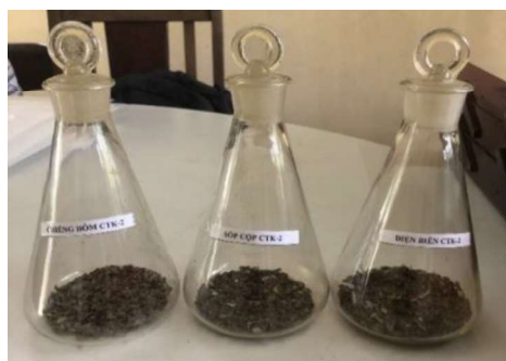
CTK - 2