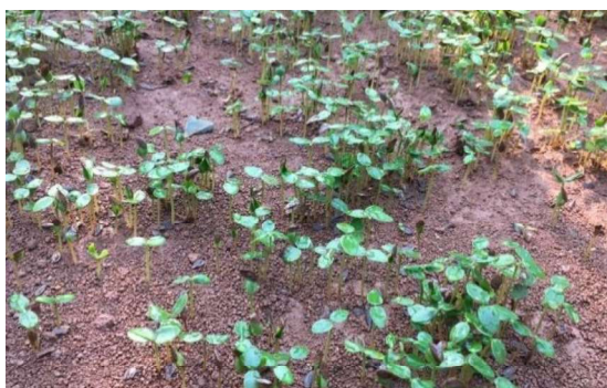
Hình 7. Cây mầm Tô hạp điện biên