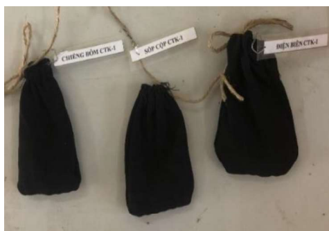
CTK - 1

Thí nghiệm bảo quản hạt giống được tiến hành trong thời gian 02 tháng (từ ngày 10/01/2022 đến ngày 17/03/2022). Các công thức thí nghiệm được bố trí như hình 5 dưới đây.