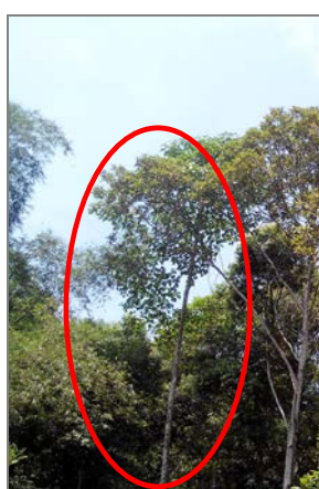
Ảnh 6. Trám trắng 14 tuổi trong rừng trồng hỗn loài ở Cầu Hai