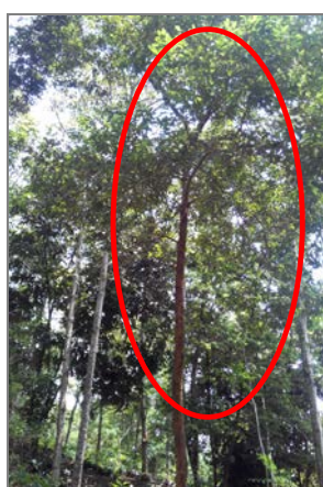
Ảnh 4. Re gừng 14 tuổi trong rừng trồng hỗn loài ở Cầu Hai