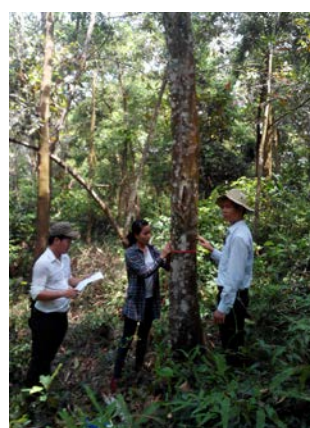
Ảnh 2. Sồi phẳng 14 tuổi trồng hỗn giao với Keo tai tượng