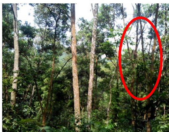
Ảnh 1. Trám trắng bị lấn át bởi cây bản địa

- Loài Trám trắng: Sinh trưởng đường kính D_{1.3} có sự sai khác rõ rệt giữa các công thí nghiệm ( Sig = 0,00 < 0,05 ). Đường kính của loài Trám trắng tốt nhất ở công thức đối chứng với D_{1.3} = 9,3\text{cm} (tăng trưởng trung bình là 0,7\text{ cm}/\text{năm} ). Về chiều cao chưa có sự khác nhau giữa các công thức ( Sig = 0,332 > 0,05 ). Do tại tuổi 14 các loài cây trong mô hình thí nghiệm đã giao tán, nên các loài cây trồng đang có sự cạnh tranh mạnh về ánh sáng. Với đặc điểm sinh trưởng chậm nên Trám trắng liên tục bị các loài cây trong mô hình vượt lên trên và Trám trắng nằm dưới tán các loài khác nên ngoài đạt tỷ lệ sống thấp thì sinh trưởng cũng rất kém.