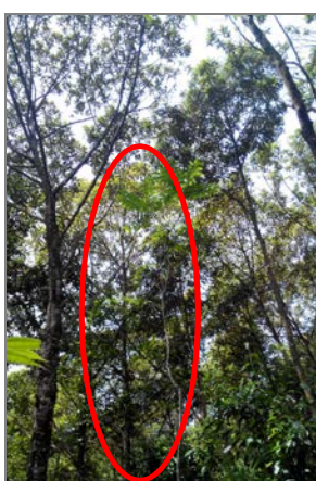
Ảnh 5. Vạng trứng 14 tuổi trong rừng trồng hỗn loài ở Cầu Hai