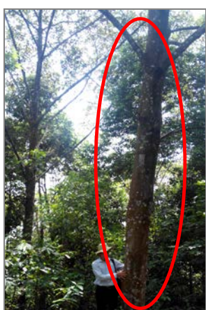
Ảnh 3. Sồi phẳng 14 tuổi trong rừng trồng hỗn loài ở Cầu Hai

là 9,4, Vạng trứng với tổng điểm trung bình là 8,6 và kém nhất là Trám trắng với tổng điểm trung bình là 8,1. Như vậy, trong 4 loài cây trồng trong mô hình hỗn loài ở Cầu Hai, Phú Thọ thì Sồi phẳng và Re gừng là 2 loài sinh trưởng, phát triển tốt nhất và có triển vọng cho trồng rừng cung cấp gỗ lớn ở Cầu Hai, Phú Thọ. Sinh trưởng, phát triển của hai loài cây Sồi phẳng và Vạng trứng ở công thức cây phù trợ là Keo tai tượng đều tốt hơn so với các công thức còn lại.