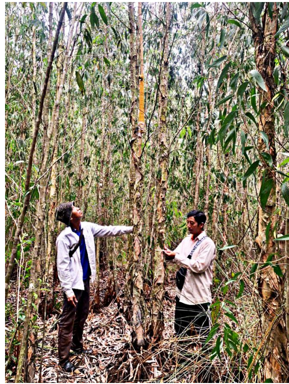
Giai đoạn 42 tháng tuổi