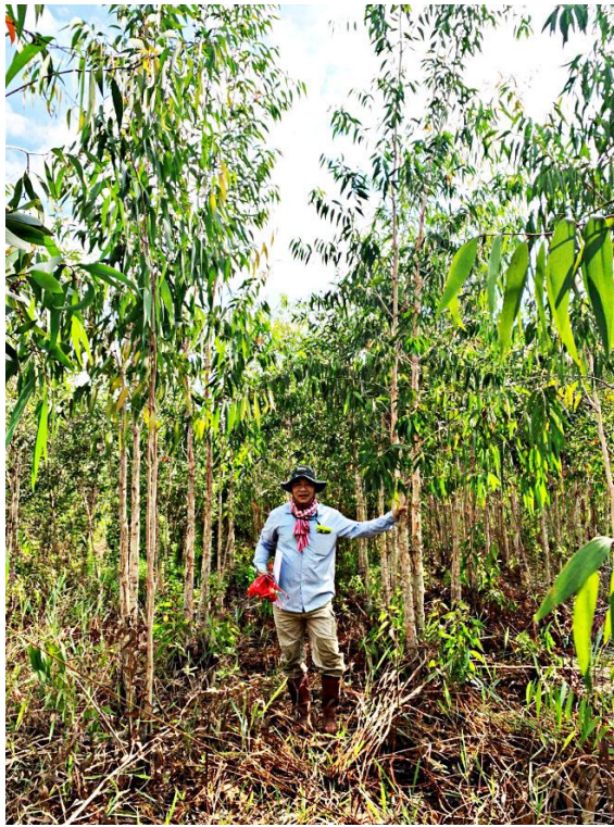
Giai đoạn 18 tháng tuổi