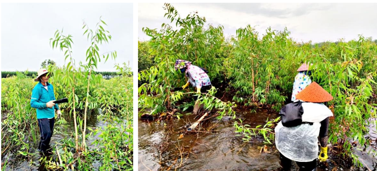
Hình 1. Rừng chồi 6 tháng tuổi và quá trình tỉa chồi

Việc bước đầu xác định tỷ lệ ra chồi và mật độ tái sinh của rừng tái sinh chồi Tràm lá dài sau khai thác trắng có ý nghĩa quan trọng trong việc đánh giá mức độ hiệu quả và là cơ sở để quyết định có nên tiếp tục duy trì hay không. Kết quả phân tích tại 20 ô đo đếm về tỷ lệ gốc ra chồi, số chồi/gốc và chiều cao chồi cho thấy: với mật độ rừng trồng ban đầu 20.409 cây/ha, mật lớp khi khai thác trắng tại thời điểm 6,5 tuổi có mật độ cây sống còn lại 7.913 cây/ha (tỷ lệ sử dụng đất 90%) được chặt hạ thì sau đó cây Tràm lá dài có khả năng tái sinh chồi mạnh. Tỷ lệ gốc ra chồi đạt 70,9% với số chồi/gốc trung bình đạt 3,8 cái và chiều cao trung bình của chồi đạt 1,3 m. Từ đó đem lại rừng tái sinh chồi có mật độ 21.222 cây/ha sau 6 tháng khai thác (hình 1). Kết quả này cũng tương tự với Phùng Cẩm Thạch (2028) khi nghiên cứu về kỹ thuật tỉa chồi Tràm ( Melaleuca cajuputi ) sau khai thác trắng tại vùng đất phèn Đồng bằng sông Cửu Long kết luận rằng, cây tràm có khả năng tái sinh chồi rất mạnh, tỷ lệ gốc ra chồi đạt 70 - 80% với số chồi trung bình 3 - 4 chồi/gốc.